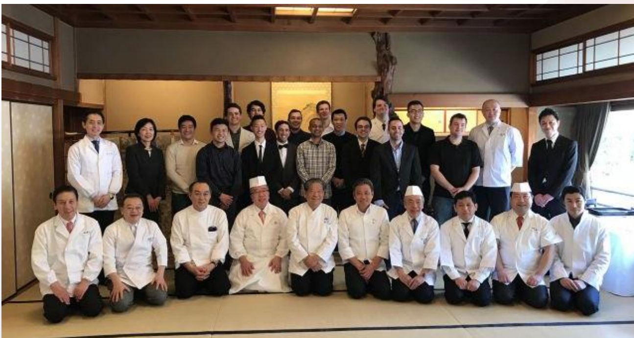
研修プログラム修了証